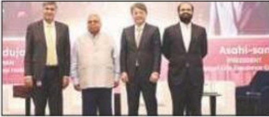
पायनियर समाचार सेवा। नई दिल्ली